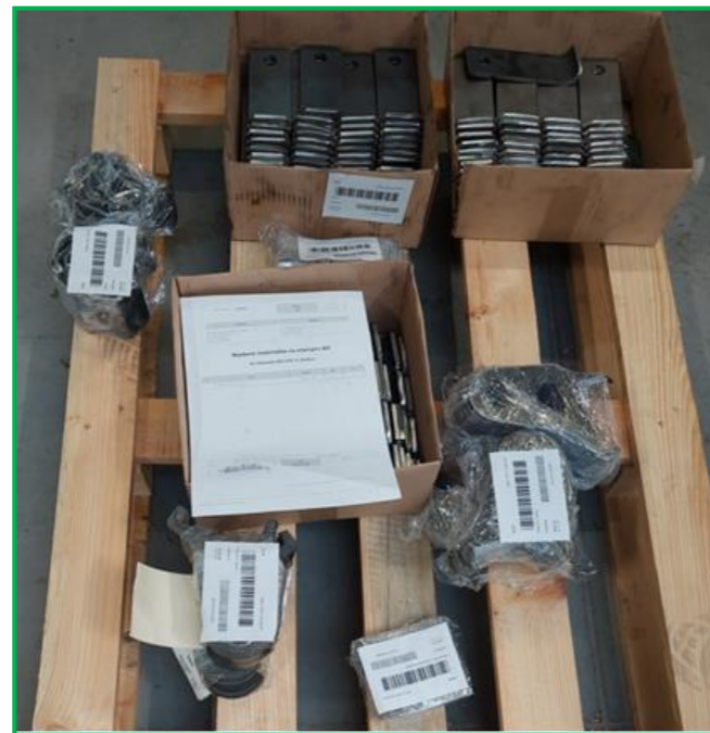
Rysunek 1. Poprawna dostawa – posortowane i oznaczone detale, dołączony dokument WZ.