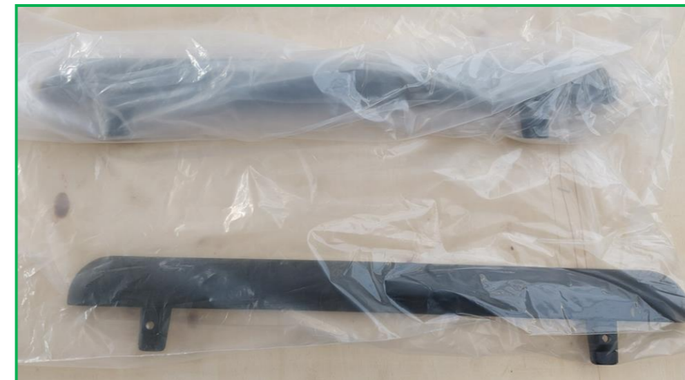
Rysunek 4. Odpowiednio zabezpieczona powłoka malowana do transportu.

7) Dostawca zobowiązany jest do dostarczenia najpóźniej razem z dostawą następujących dokumentów: