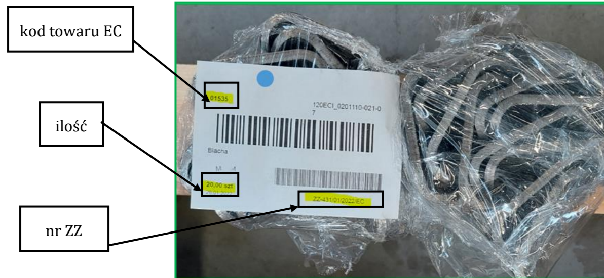
Rysunek 3. Prawidłowa etykieta dołączona do detali.